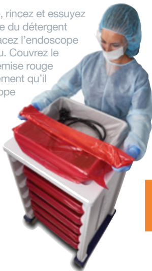
TRANSPORT D'ENDOSCOPES CONTAMINÉS

Après la procédure, rincez et essuyez l'endoscope à l'aide du détergent INTERCEPT MC et placez l'endoscope sale dans le plateau. Couvrez le plateau avec la chemise rouge pour indiquer clairement qu'il s'agit d'un endoscope « CONTAMINÉ ».